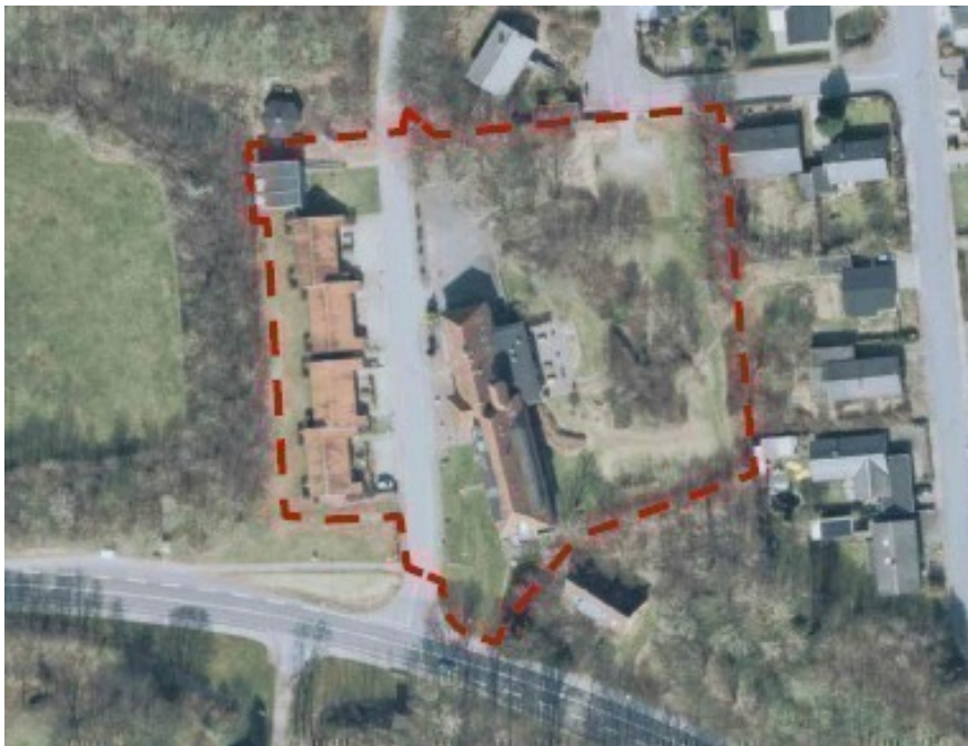
Lokalplanområdet fra lokalplanen kortbilag 2. lokalplanafgrænsningen.